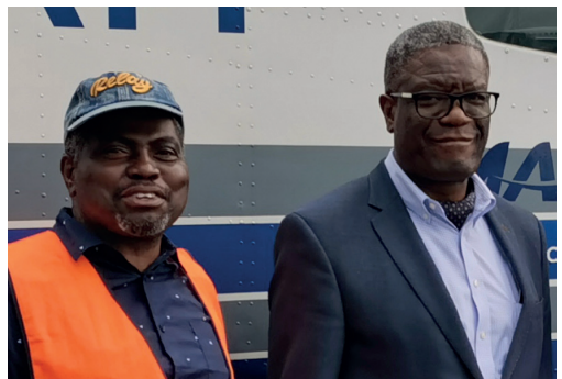
Le Prix Nobel de la Paix Docteur Mukwege qui revient de Suède va monter dans ce petit porteur pour rejoindre Bukavu