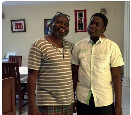
Avec mon fils chez moi à Goma