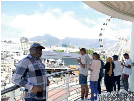
Capetown, un jour avant mon retour à Kigali-Goma