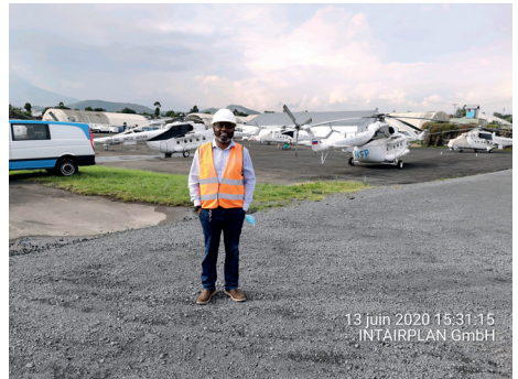
Héliport nations unis aéroport de Goma