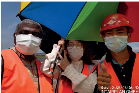
Une des deux interprètes du projet de l'aéroport de Goma