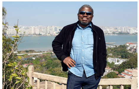
Un peu de tourisme