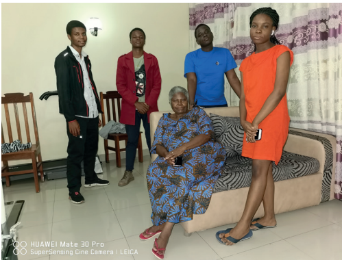
La Maman et deux cousins venus de Bukavu pendant le séjour des enfants à Goma,