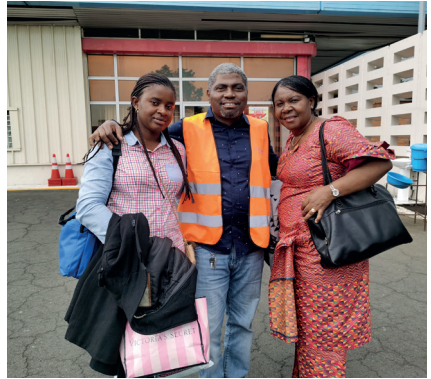
Une cousine avec sa fille venant de Suède rencontrée par hasard à Goma,